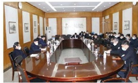
院党委理论学习中心组会议