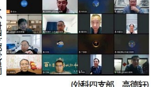
外科四支部党员大会